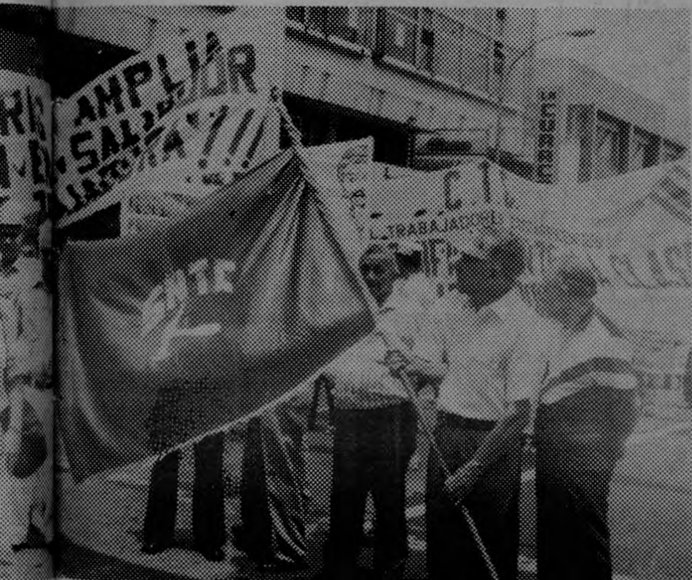
El Partido de los Trabajadores ha estado presente desde los primeros años en que se organizó la lucha de los trabajadores.