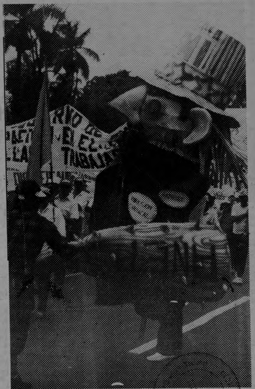
¡Duro! ¡Duro! al FMI, coreó la gente cuando este afiliado de la ANEP, perseguía al monigote que representaba la figura de esa detestable agencia del imperialismo.