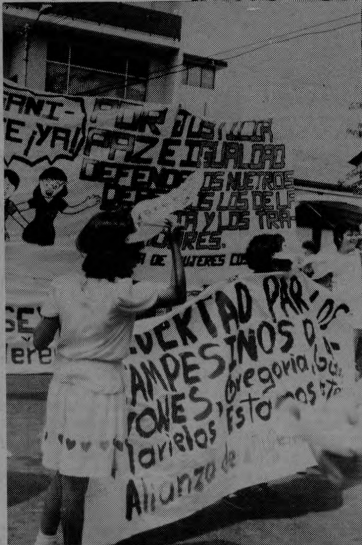
(arriba) La Alianza de Mujeres Costarricenses exigió la libertad de los campesinos de Pavones encarcelados por la policía.

En otra parte de su intervención el coordinador del CPT se refirió a las negociaciones que se llevan actualmente con el Gobierno- producto de los paros efectuados en marzo- y señaló que hay avances importantes aunque no se marcha con la celeridad requerida y finalizó afirmando: "Pero el hecho de tener el Gobierno una actitud de diálogo a las negociaciones, no significa que todo está solucionado; por el contrario, hoy más que nunca es cuando debemos estar alertas, pues los problemas de la clase trabajadora son muy graves y no iremos a caer en actitudes negativas a estrategias de desmovilización de parte del Gobierno, continuaremos nuestra lucha como única alternativa de la clase trabajadora costarricense".