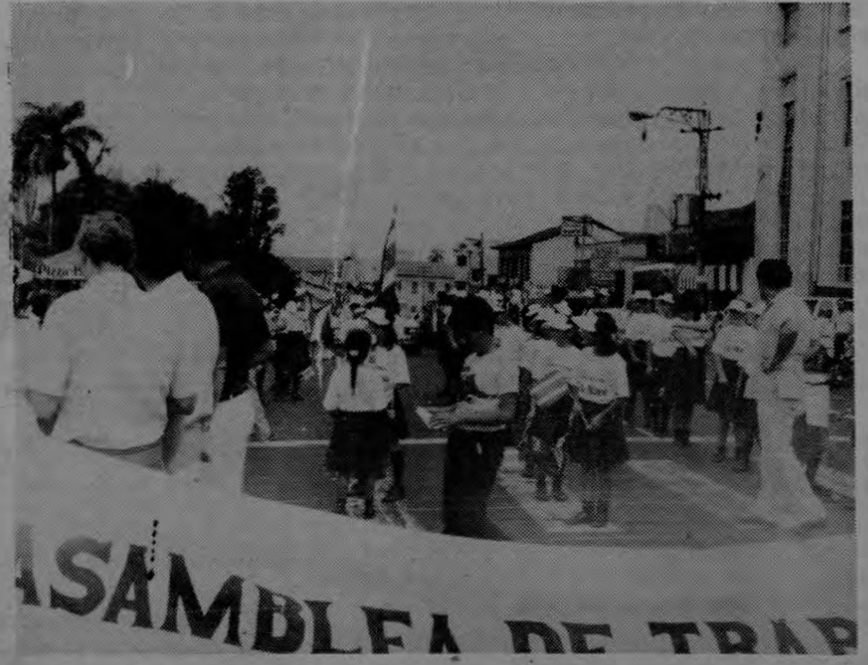
El desfile fue encabezado por un grupo de estudiantes que también se sumaron a la celebración del Día Internacional de los trabajadores.