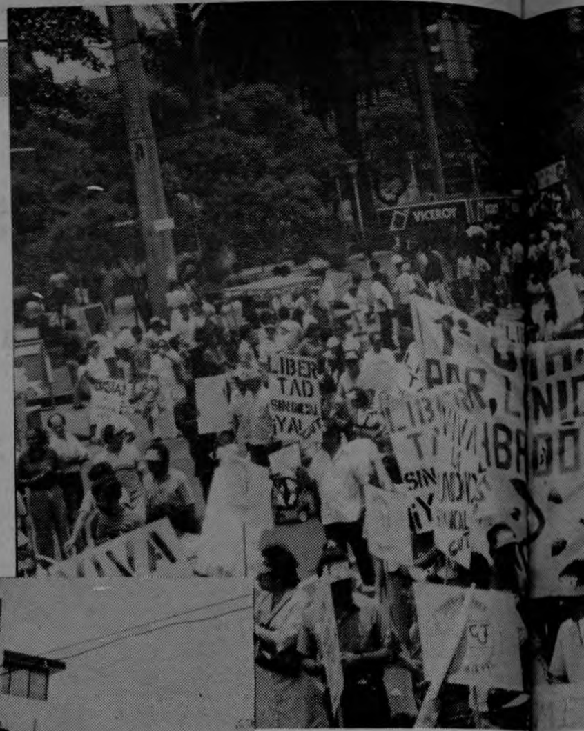
Varias cuerdas de la avenida Segunda se celebró el Día Internacional de los Trabajadores, la nota predominante.