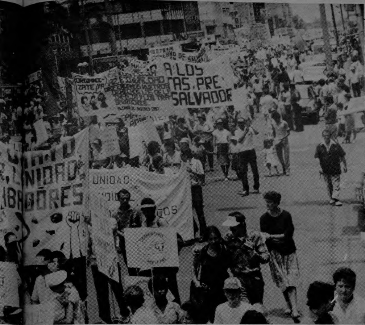
La avenida cubrió el desfile del 1º de Mayo, donde la unidad y la denuncia fueron el eje.