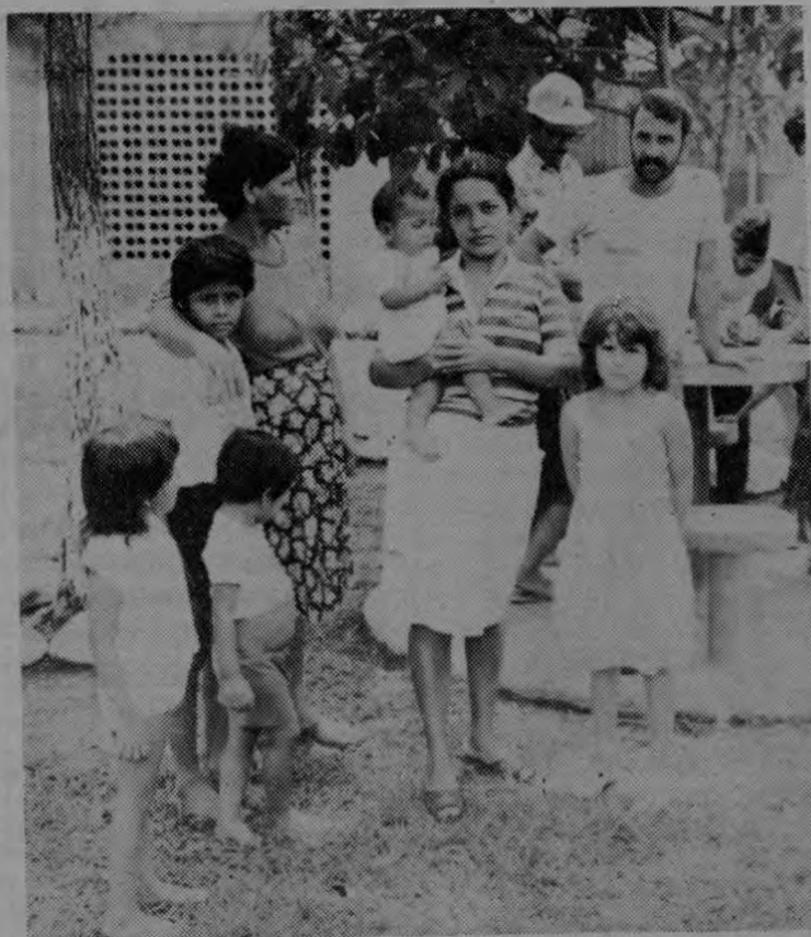
En una clara violación de los derechos humanos, once niños guardan prisión junto a sus padres

Los campesinos de la comunidad de Pavones, situada en el cantón de Golfito, muy cerca de Punta Burica, han venido llevando a cabo una lucha por la tierra des-