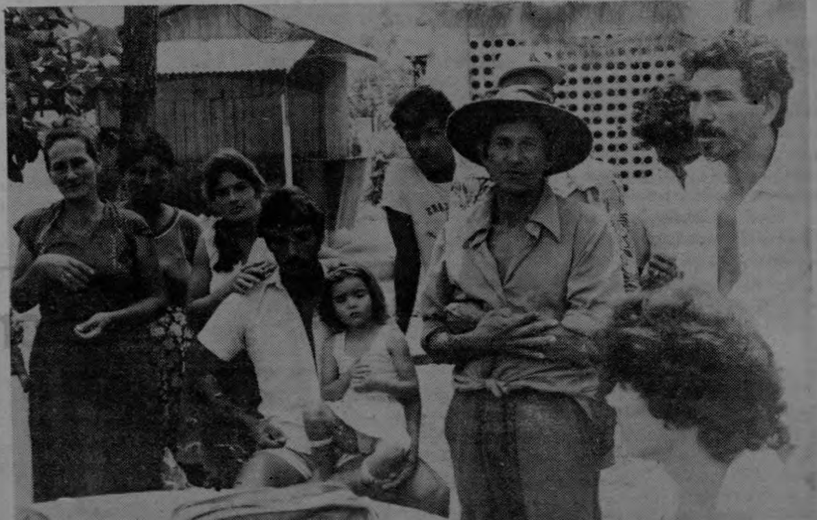
Los campesinos relataron los atropellos de que han sido víctimas

Sr. Oscar Arias Sánchez Presidente de la República Casa Presidencial-Zapote San José