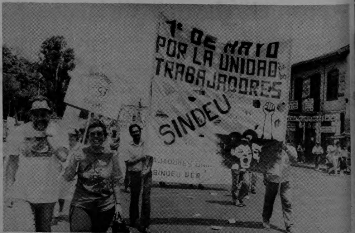
(Abajo) Los trabajadores de la Universidad de Costa Rica se sumaron con entusiasmo y combatividad al desfile.