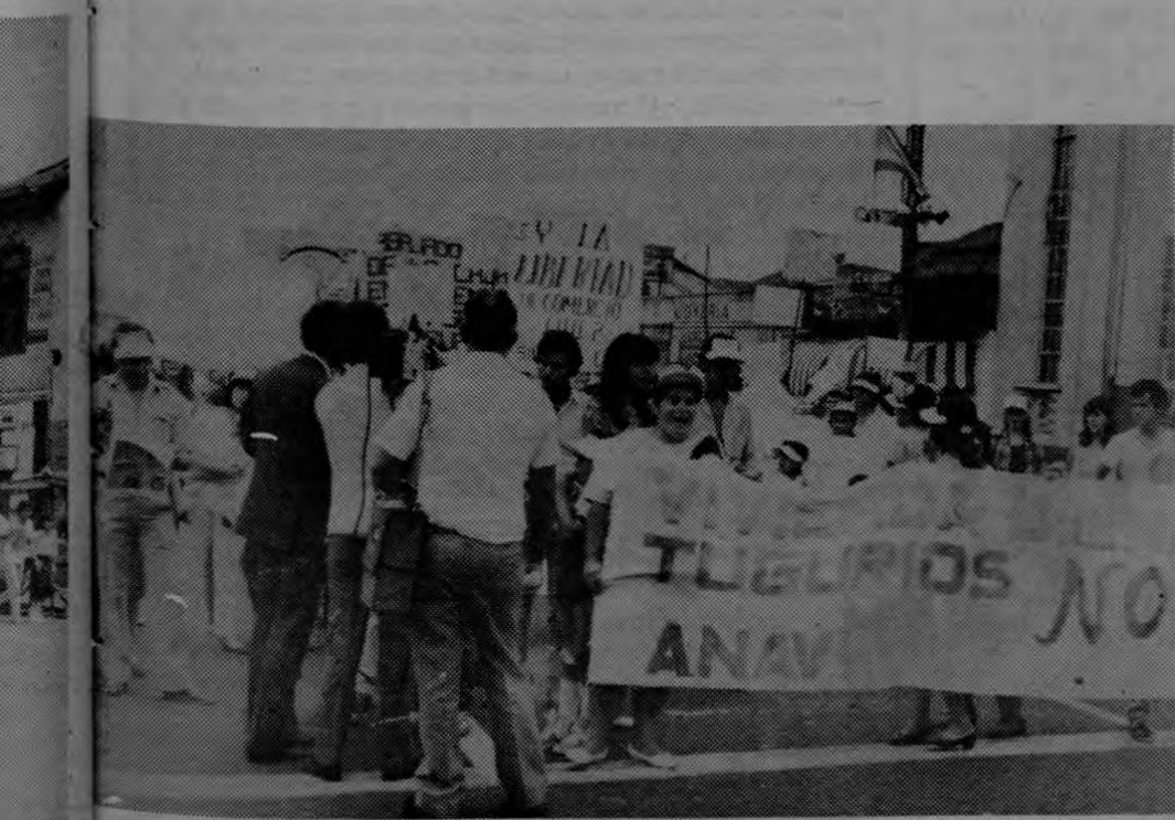
La denuncia contra el tugurio y por vivienda digna fue planteada por la Asociación Nacional de la Vivienda (ANAVI)