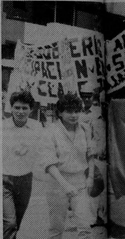
El legendario sindicato de Pavones se celebra el Día Internacional de los Trabajadores.